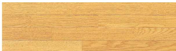
ナチュラル(なら銘木単板)

NKL-15KC ●303×1,818×15mm ¥20,000/坪(¥6,061/㎡)6枚入