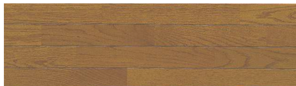
ブラウン(なら銘木単板)

NKL-15N ●303×1,818×15mm ¥20,000/坪(¥6,061/㎡)6枚入